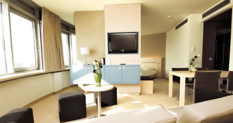
ATLANTIC HOTEL SAIL City