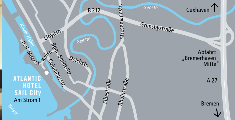
IHR WEG ZU UNS HOW TO FIND US